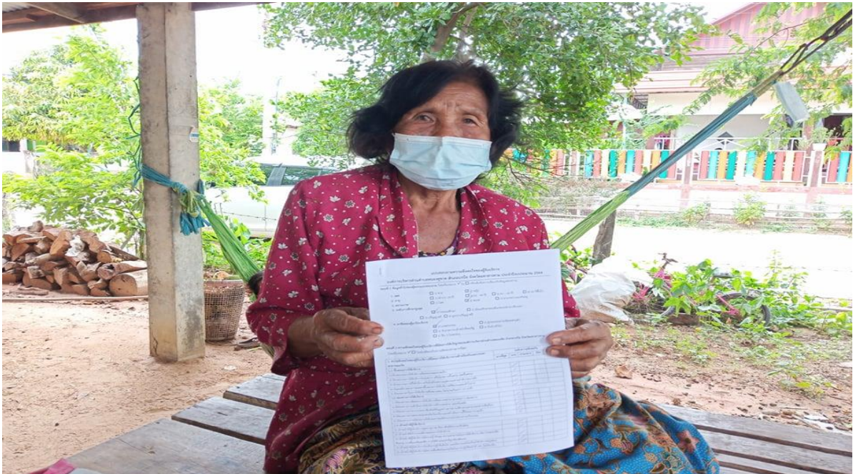
รูปภาพที่ 4.3 การเก็บข้อมูลในชุมชนตำบลหนองคูขาด