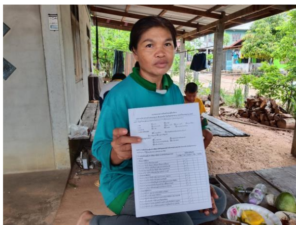
รูปภาพที่ 4.1 การให้ข้อมูลของประชาชนในพื้นที่ อบต.หนองคูขาด