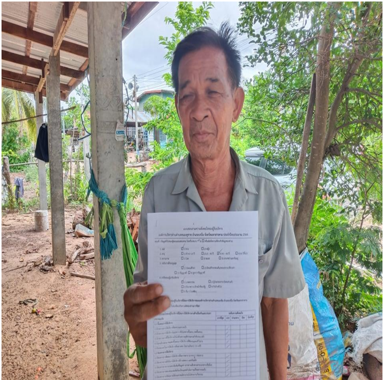
รูปภาพที่ 4.2 การเก็บข้อมูลในชุมชนตำบลหนองคูขาด

6) ผลสรุปโดยรวมทั้ง 5 ด้าน มีความพึงพอใจอยู่ในระดับมากที่สุด (Mean = 4.79) คิดเป็นร้อยละ 95.88