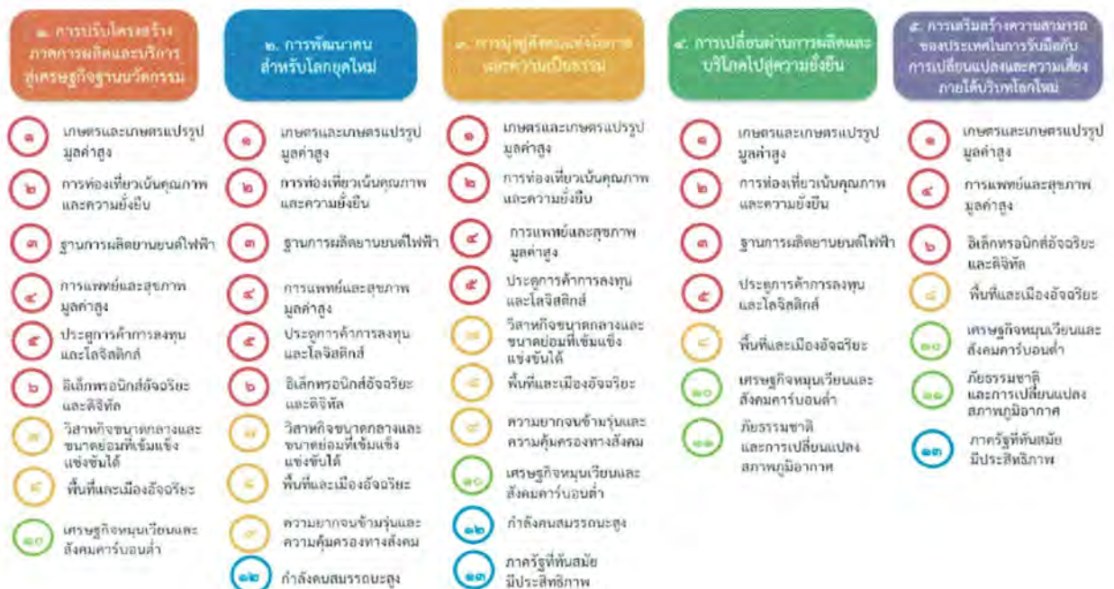
แผนภาพที่ ๓.๑ ความเชื่อมโยงระหว่างหมวดหมู่การพัฒนา กับเป้าหมายหลัก

ความเชื่อมโยงระหว่างหมวดหมู่การพัฒนา กับเป้าหมายหลักแสดงไว้ในแผนภาพที่ ๓.๑ โดยหมวดหมู่ การพัฒนาที่กำหนดขึ้นเป็นประเด็นที่มีลักษณะเชิงบูรณาการที่ครอบคลุมการพัฒนาตั้งแต่ในระดับต้นน้ำจนถึง ปลายน้ำ และสามารถนำไปสู่ผลพัฒนาทั้งในมิติเศรษฐกิจ สังคม ทรัพยากรธรรมชาติและสิ่งแวดล้อมไปพร้อมๆ กัน ทำให้หมวดหมู่แต่ละประการสามารถสนับสนุนเป้าหมายหลักได้มากกว่าหนึ่งข้อ นอกจากนี้การพัฒนาภายใต้แต่ละ หมวดหมู่ไม่ได้แยกขาดจากกัน แต่มีการสนับสนุนหรือเอื้อประโยชน์ซึ่งกันและกัน